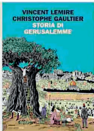
Storia di Gerusalemme Vincent Lemire, Christophe Gaultier Einaudi, pp. 256, 25 euro

Nel lembo di terra più conteso della storia si sono avvicendate decine di civiltà diverse. Una narrazione a fumetti appassionante, e indispensabile, per ripercorrerne le evoluzioni e conoscere le radici dei conflitti a cui assistiamo oggi. A raccontare i territori in cui sono nati i grandi monoteismi, è un importante storico francese che, utilizzando fonti archeologiche e documenti inediti, realizza un accurato ritratto di questa città-mondo, dalle origini ai nostri giorni.