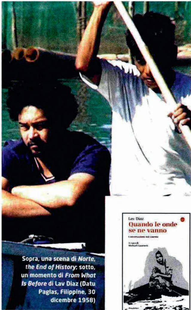
Sopra, una scena di Norte, the End of History ; sotto, un momento di From What Is Before di Lav Diaz (Datu Paglas, Filippine, 30 dicembre 1958)