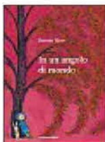
JIMMY LIAO IN UN ANGOLO DI MONDO (Camelozampa) Rifugi per ritrovarsi: un poetico albo illustrato