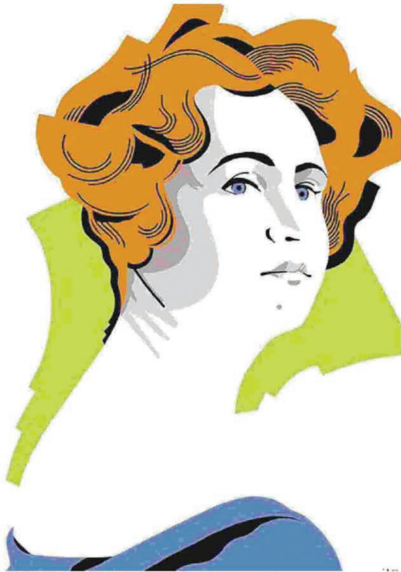
AUTRICE Sibilla Aleramo nel disegno realizzato per la copertina del volume

Nelle antologie del Novecento pregiudizio contro le donne