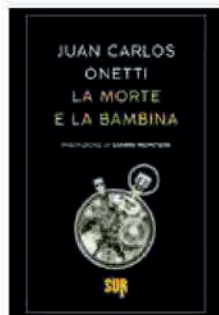
LA MORTE E LA BAMBINA Juan Carlos Onetti SUR, pp. 112, € 10

d'improvviso qualcosa cambia e allora conta l'ora, il minuto, l'attimo esatto in cui le cose accadono: di notte specialmente, o all'alba, quando il sonno confonde ancora le verità fatte visioni. "La morte e la bambina" (nella traduzione di Gina Maneri) raduna quel cosmo di diffidenze e di riti, di sospetti e di abitudini, di gente che si spia dalle finestre o che riversa le sue colpe alle grate di un confessionale, che abbiamo conosciuto in altri romanzi, sullo stesso sfondo dell'immaginaria